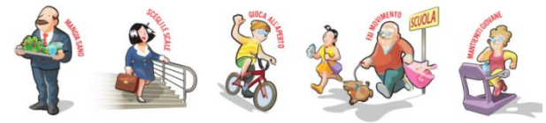
Saatchi & Saatchi Healthcare – Illustrazioni di Lorenzo Sabbatini