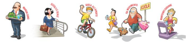
Saatchi & Saatchi Healthcare – Illustrazioni di Lorenzo Sabbatini