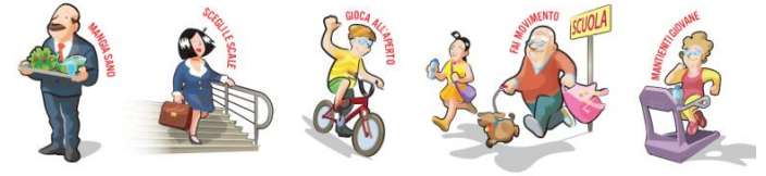
Saatchi & Saatchi Healthcare – Illustrazioni di Lorenzo Sabbatini